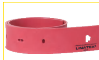
rubbers kunnen 4-zijdig gebruikt worden en zijn zuur en alkalie bestendig