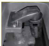
vuilwatertank voorzien van vlotter