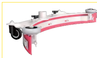
de zuigmond is gemakkelijk afneembaar en de rubber eenvoudig te vervangen