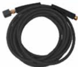
Hogedrukslang 3/8" lengte 10 meter