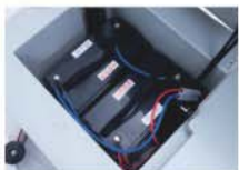
WET accu 12V 150A 2x