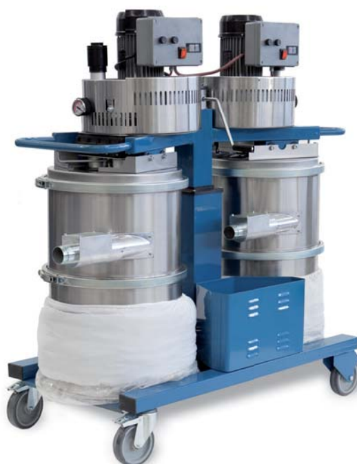
Mogelijkheid om de constructie te laten zakken om transport te vereenvoudigen