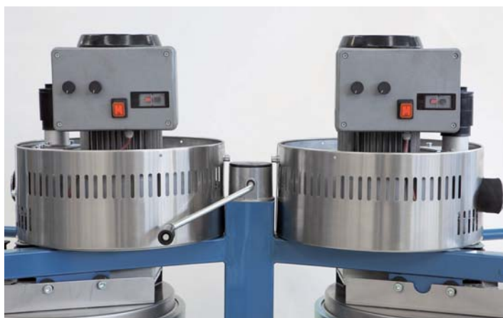
Automatische en tijdgestuurde filter reiniging

Stofzuiger uitgevoerd met dubbel turbine- en filtersysteem geschikt voor zeer fijn stof. Deze machine is uitgevoerd met een automatisch en tijdgeschakeld filter reinigingssysteem en biedt de mogelijkheid om stof af te voeren tijdens de werking. Deze voorzieningen zorgen voor een constante filter efficiëntie en vuil afvoer, zodat de zuiger continue kan werken. Dit apparaat is geschikt voor gebruik in de voedsel- en chemische industrie, alsmede in de bouw en hout verwerkende industrie, en voor oppervlakte bewerking, zoals vloeren polijsten. Het is mogelijk om het stof in een zak op te vangen zodat tijdens het ledigen niets in het milieu terecht komt. Dankzij ons systeem van non-stop zak vervangen; LONGOPAC® is het mogelijk om de zak te vervangen zonder in contact te komen met het stof. Ook leverbaar in ATEX ⚠️ uitvoering