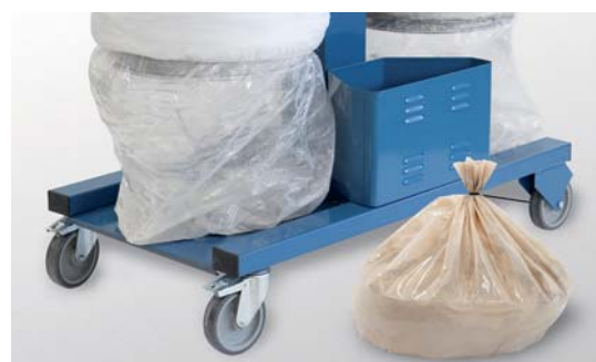
Zak klaar om af te voeren