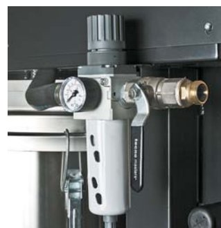
Reduceer ventiel met filter