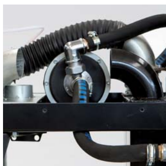
Zelf regulerende energie bespaar klep