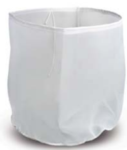
Zak voor fijne metaaldeeltjes *