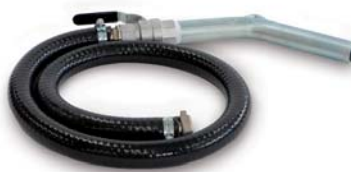
Vloeistof afvoer nozzel *