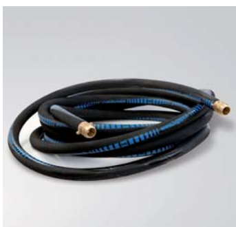
Geleidende perslucht-slang compleet

11 PN : Machine geschikt voor het opzuigen van metaal spanen, olie, en emulsies in o.a. de verspanende industrie.