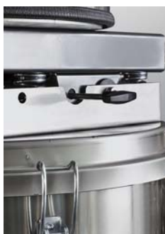
Luchtstroom omkeerhendel voor automatische filter reiniging.