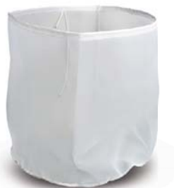
Zak voor fijne metaaldeeltjes *