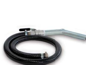
Vloeistof afvoer nozzel *