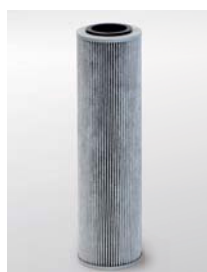
Hepa filter (optioneel)