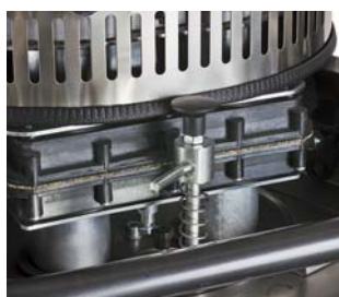
Hendel voor automatische vloeistof afvoer. (CAR 1155 S)