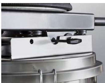
Luchtstroom omkeermhendel voor automatische filter reiniging en vloeistof afvoer.