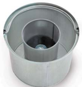
Metaal spanen opvangmand met vlotter *